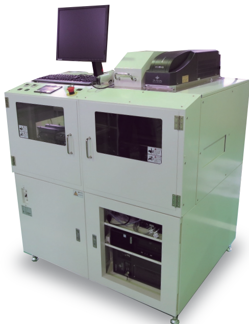
(写真は供給ブッシェのオプション仕様付き)