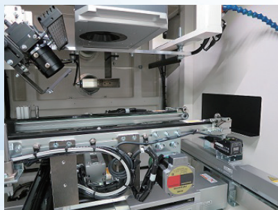
(写真は、オプションのシャインブルーカメラ付です)