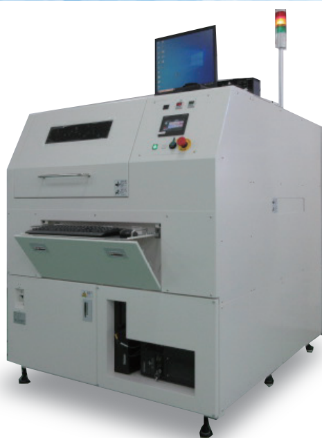
(写真は、L基板対応装置でオプションを含んだ装置となります)